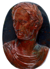
EXILUL DE LA ASCALON ȘI ÎNTÂLNIREA CU IULIUS CEZAR