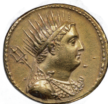
DEVINE REGINĂ, ÎMPREUNĂ CU FRATELE ȘI SOȚUL EI, PTOLEMEU AL XIII-LEA